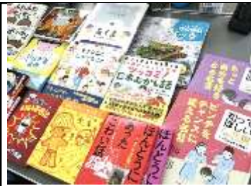
カンコンプロジェクトで学級文庫となる図書を購入