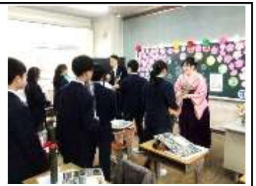
卒業生 お別れの様子